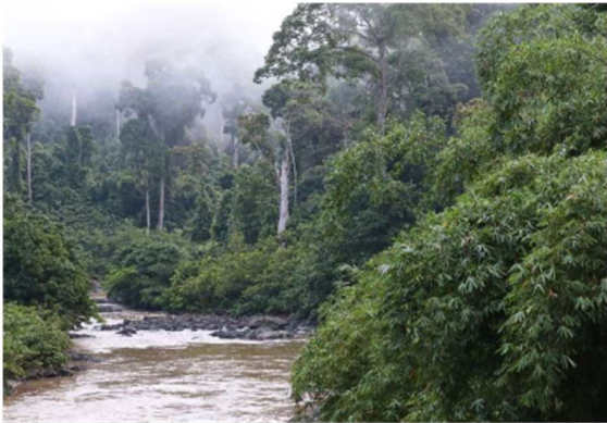
Rzeka Danum nieopodal Danum Valley Field Centre

Kurs ekologii tropikalnej (Tropical ecology field course) jest prowadzony na Uniwersytecie Jagiellońskim od roku 2007. Jest to kurs praktyczny, prowadzony w języku angielskim, w czasie którego studenci zdobywają wiedzę i umiejętności, które mogą bezpośrednio wykorzystać w budowaniu swojej przyszłej kariery zawodowej. W czasie trzytygodniowego pobytu w stacji terenowej uczestnicy kursu realizują projekty badawcze pod opieką nauczycieli akademickich, w tym także specjalistów z różnych dziedzin biologii tropikalnej związanych z pracą stacji badawczych. Wyniki najlepszych projektów są publikowane w międzynarodowych czasopismach naukowych indeksowanych w Web of Science. W oparciu o materiały związane z kursem powstały także dwa zeszyty czasopisma „Wszechświat”, w całości poświęcone tropikom. Pierwsze edycje kursu odbywały się w stacji Rancho Grande w Wenezueli, a obecnie kurs prowadzony jest naprzemiennie w stacji La Gamba w Kostaryce i w Danum Valley na Borneo.