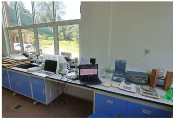
Laboratorium w Danum Valley Field Centre