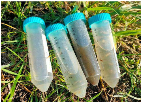
Zbiór próbek wody do probówek typu FALCON 50 ml.

Wynikiem badań jest nie tylko powiększenie unikalnej w skali światowej kolekcji Paramecium ISEZ PAN czy opisy nowych gatunków przy użyciu taksonomii integracyjnej, ale także zwiększenie wiedzy na temat bioróżnorodności Protista, które są istotnym składnikiem biosfery.