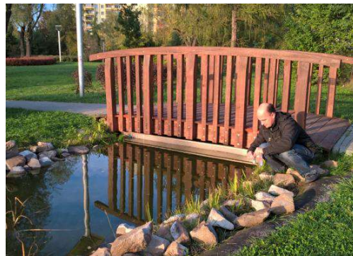
Zbiór próbek wody - nawet niewielki staw w parku kryje w sobie obecność kilku gatunków Paramecium