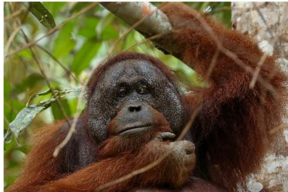
Orangutan borneański ( Pongo pygmaeus )