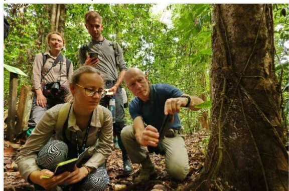
Badacze przy pracy