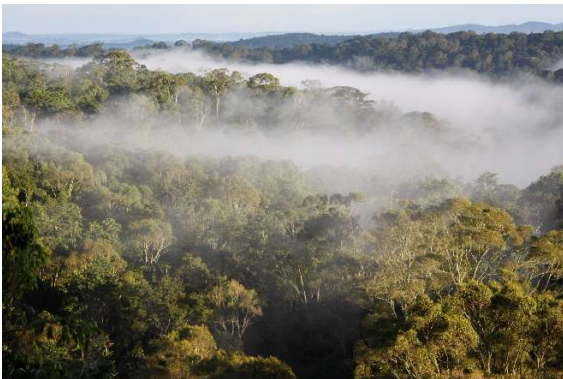
Kibale National Park – las tropikalny o poranku

Jedną z wielu niespodziewanych i niezapomnianych „atrakcji” wyjazdu była degustacja żywych termitów podczas nocnych odłowów gdzieś w środku tropikalnego lasu Kibale - a jak do tego doszło, będzie można dowiedzieć się podczas wykładu.