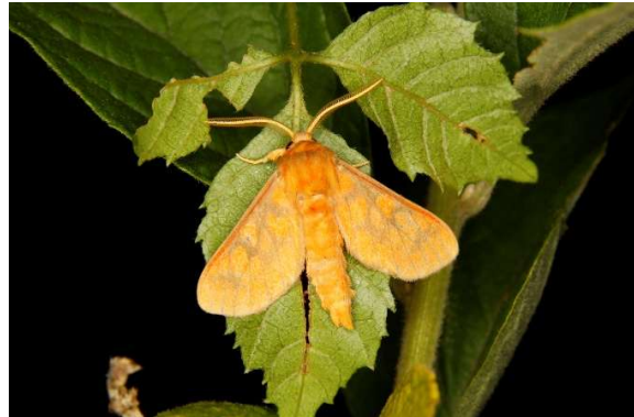
Rhipidarctia paraclecta (niedźwiedziówka)