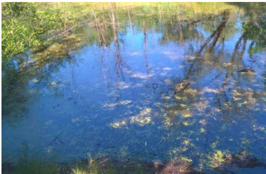
Staw przy Cegielni/Kraków - jedno z wielu miejsc zbioru próbek. Obecność butwiejącej roślinności sprzyja rozwojowi bakterii, które są pokarmem orzęsków z rodzaju Paramecium .